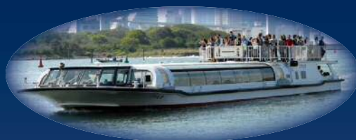
東京水辺ライン「こすもす」に乗船